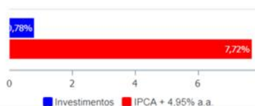
Investimentos x Meta de Rentabilidade