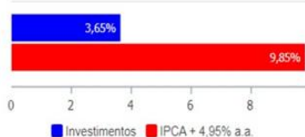
Investimentos x Meta de Rentabilidade

Meta da Rentabilidade até Novembro de 2022: